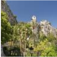
Castell de Guadalest [6]