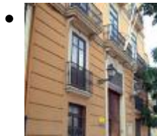
Maison Musée José Benlliure [13]