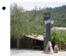
Collection De Véhicules Anciens Vallée De Guadalest [14]

Collection qui regroupe une centaine de motos et plusieurs petites voitures, en parfait état et entièrement d'origine, datant des années 20 à 70