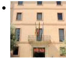
Musée Fallero [11]