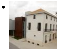
Musée du Doctor Mas Magro [1]