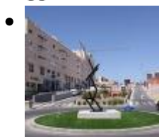
Homenaje a El Campello [3]