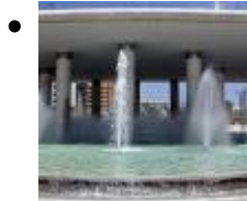
La Font del Centenari [1]