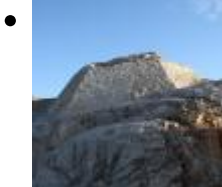
Tour Bombarda [8]

Au milieu d'un magnifique paysage de pins se conserve toujours les restes de cette tour qui faisait partie du système de défense et surveillance de la ville.