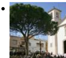
Église Paroissiale [10]

À l'origine ce temple était dédié à San José , premier patron du village, mais de nos jours il est dédié au Cristo del Buen Acierto , une taille qui fut sauvée du brûlage du couvent de Valencia où elle était gardée et qui fut faite don aux alfasins.