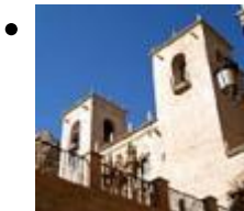
Église De Santa María [13]