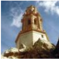
Tour Mudéjar ou des Cloches ou Alcudia [7]