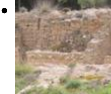
Muraille et Forteresse Phénicienne [6]