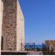
Château de Guardamar [4]