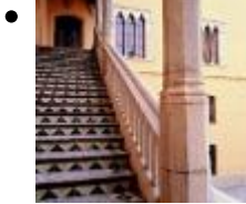
Palais Ducal [8]

Un arc en plein cintre et un écusson de la famille donnent accès à la maison où naquit Francisco de Borja. A l'intérieur on peut visiter les différentes chambres décorées par les éléments architectoniques de six siècles d'histoire : le gothique, le baroque, la Renaissance et le néoclassique.