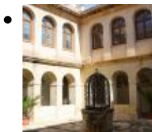
Église de l'Ancien Couvent de San José [1]

L'ancien Couvent de San José de moines franciscains fut transformé, au XVIII e siècle, en hôpital. De nos jours il éberge la bibliothèque et l'archive municipale, restaurés. On distingue l'église baroque et le cloître.