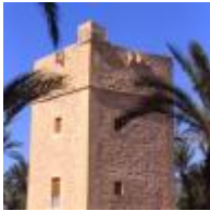
Tour de los Vaillos [7]

La tour se trouve à l'intérieur de l'ensemble patrimonial. De nos jours elle présente 4 étages.