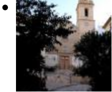
Église de San Bartolomé [10]

En plein cœur du centre historique, le temple consacré à Saint Bartolomé, se dresse à côté de son clocher, sur la plaza de la Torreta.