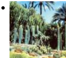
Huerto del Cura (inclu à l'ensemble du Palmeral, Patrimoine de l'humanité ) [8]

Avec plus de 13.000 mètres carrés de plantes tropicales et méditerranéennes, ce jardin exotique fut déclaré Jardin Artistique National en 1943. De plus, il exhibe le seul exemplaire de palmier à dattes avec sept enfants, connue comme le Palmier Impérial.