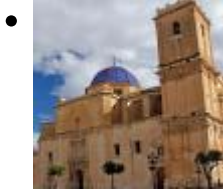
Basilique de Santa María [10]