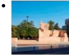
Fortifications et Tours [11]