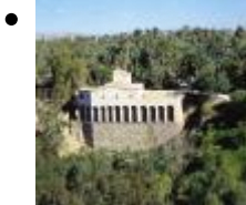
Molí del Real [8]

L'édification s'utilisait comme moulin et entrepôt de graines. Il est d'origine médiévale.