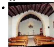
Ermitage de Santa Paula [3]

L'ermitage de Santa Paula est un des ermitages de la Conquête et accueillit un