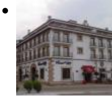
Entrepôts Portuaires (Anciens Chantier Naval) [4]

Le bâtiment se trouve de nos jours hors catalogue, puisque le développement et le commerce n'ont gardé de l'ancien chantier naval que son aspect extérieur, qui présente une toiture en tuile arabe.