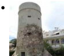
Tour Almadraba [6]