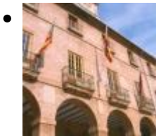
Mairie de Dénia [7]

Lorsque la tour du Consell ne fut plus utilisée, les autorités se sont déplacées à l'actuelle mairie, de style gothique, avec une façade baroque ajoutée.