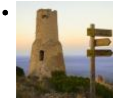
Torre del Gerro [5]

Sa position privilégiée permettait le contrôle de presque tout le Golfe de Valencia. Sa particularité consiste en la division de la bâtisse centrale. Elle possède un écusson d'armes.