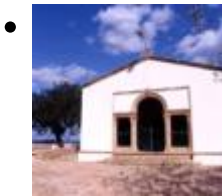
Ermitage de San Juan [8]

Dans une contrée exceptionnelle, le blanc ermitage de San Juan fait partie de ce qu'on appelle 'ermitages de la conquête', qui furent construits après la reconquête chrétienne de la municipalité.