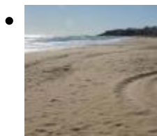
Playa Morro de Gos [3]