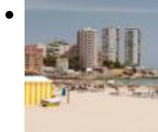
Playa Concha [1]