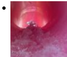
Aquarama Benicàssim [4]

Ce parc aquatique s'étend sur plus de 45000 m2 pour la plus grande joie des grands et petits.