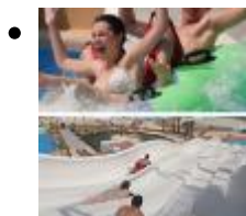
Aqua Natura [1]