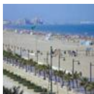
Plage Malvarrosa [1]