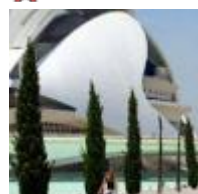
Palau de Les Arts Reina Sofía [7]