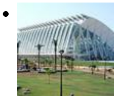
Museu de les Ciències Príncep Felipe [3]

Il est aussi spectaculaire de l'extérieur que de l'intérieur. Le bâtiment se dresse sur cinq étages et s'étend sur une surface de 42 000 m 2 , le Musée de las Ciencias a été