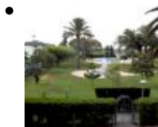
Devesa Gardens [4]