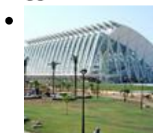
Museu de les Ciències Príncep Felipe [3]

Il est aussi spectaculaire de l'extérieur que de l'intérieur. Le bâtiment se dresse sur cinq étages et s'étend sur une surface de 42 000 m2, le Musée de las Ciencias a été construit en respectant u...