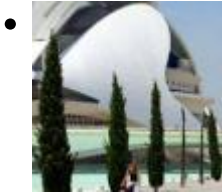
Palau de Les Arts Reina Sofía [7]

Le dernier, et surtout le plus spectaculaire des bâtiments de la Ciudad de las Ciencias (La Ville des Arts et des Sciences) a été conçu comme un centre culturel global,...