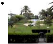
Devesa Gardens [4]

Ce complexe touristique se situe au Parc Naturel de l'Albufera, à quelques 13km de Valencia, près de la mer et le Terrain de Golf de El Saler, dans une forêt de pins, rizières et le lac magnifique....