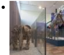
Musée De Sciences Naturelles (Musée Paléontologique) [11]