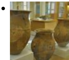
Musée De Préhistoire Et Des Cultures De Valencia. La Bienfaisance [9]