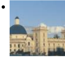
Musée Des Beaux-Arts De Valencia - San Pío V [10]