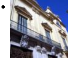
Palais Marquis De Campo-Musée De La Ville [7]