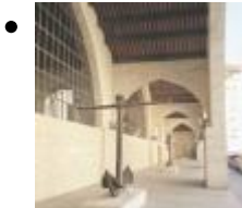
Chantier Naval (Atarazanas) [5]

L'ancien chantier naval et entrepôt d'ustensils fût transformé et de nos jours s'utilise comme salle d'expositions temporaires.