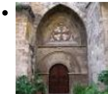
Ensemble Hospitalier De San Juan De L'hôpital [6]