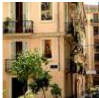
Ensemble historique de la ville de Valencia [11]