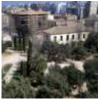
Ensemble Historique Artistique (Zones de l'Ancien Hôpital) [4]