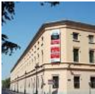
Casa de la Beneficencia. Musée de Préhistoire et des cultures de Valencia [9]