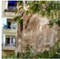
Muraille Médiévale [10]