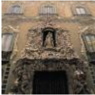
Palais Du Marquis De Dos Aguas (Musée National De Céramique) [7]