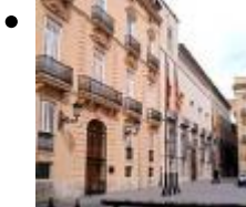
Plaza de Manises [5]