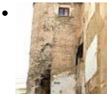
Tour Adossée au Pan de la Muraille Arabe entre les Rues Ángel Beneito et Coll [6]

Elle fait partie de la muraille construite lors du royaume de Abd al-Azid, au début du XI siècle, quand la ville était la capitale d'un royaume de Taifa et éprouva une énorme croissance.