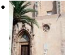
Monastère De La Trinité [10]