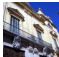
Maison Du Marquis De Campo. Musée De La Ville [7]