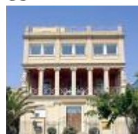
Chalet de D. Vicente Blasco Ibañez [8]