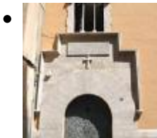
Maison de Naissance San Vicente Ferrer [5]