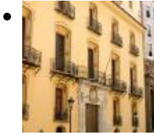
Palais du Marquis de Huarte ou de Peñalba (Siège du Banco Urquijo) [4]

La façade se trouve encadrée par deux donjons courbés et achevés avec deux boules. Les formes ondulantes sont présentes aux balcons où les lignes qui se dessinent son de style français.