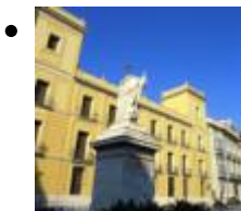
Palais Des Comtes De Cervellón [6]