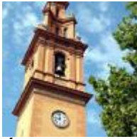
Église Paroissiale De Nuestra Sra De La Misericordia (Notre Dame De La Miséricorde, Quartier Campanar) [9]