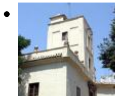
Ferme Juliá [1]