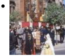
Festivité de San Vicente Ferrer [7]